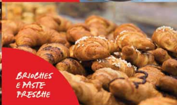
BRIOCHE E PASTE FRESCHE