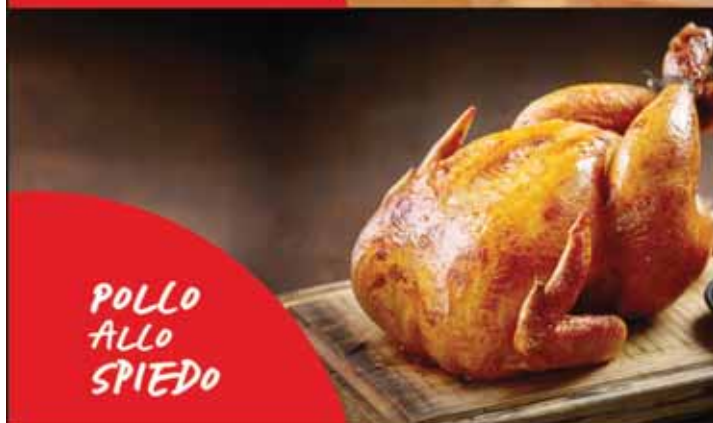
POLLO ALLO SPIEDO